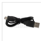
Cavo di alimentazione USB